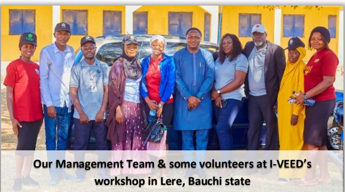
Our Management Team & some volunteers at I-VEED's workshop in Lere, Bauchi state