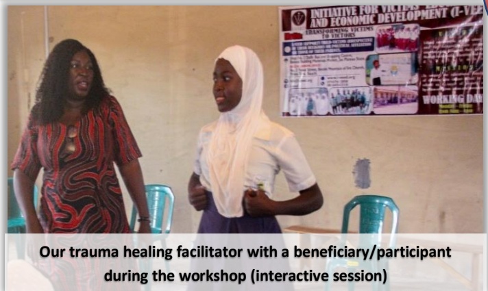
Our trauma healing facilitator with a beneficiary/participant during the workshop (interactive session)