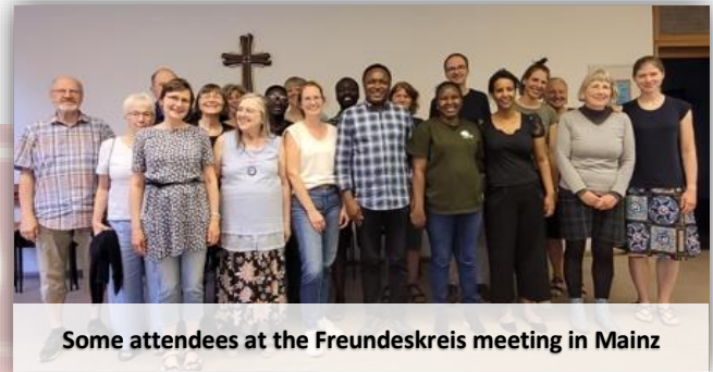
Some attendees at the Freundeskreis meeting in Mainz

Auf unserer Website finden Sie die Namen und Profile des Organisationsteams des I-VEED Freundeskreises Deutschland zu sehen.