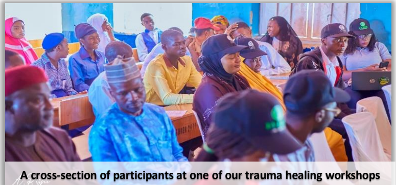
A cross-section of participants at one of our trauma healing workshops