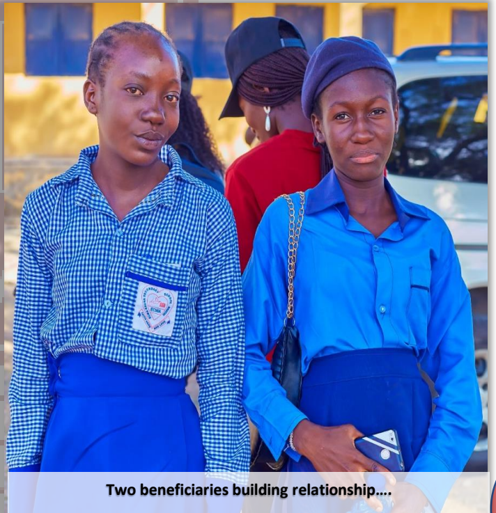
Two beneficiaries building relationship....