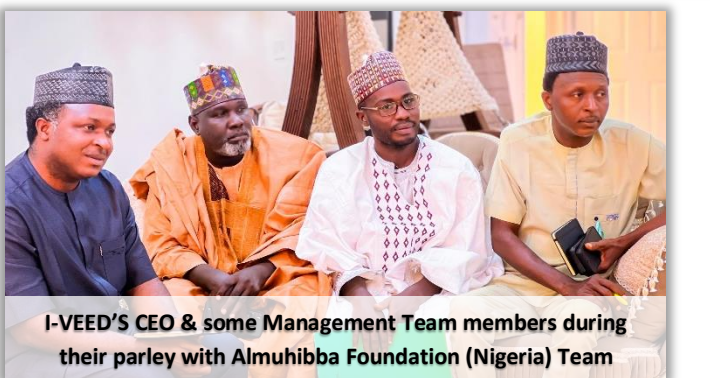
I-VEED'S CEO & some Management Team members during their parley with Almuhibba Foundation (Nigeria) Team