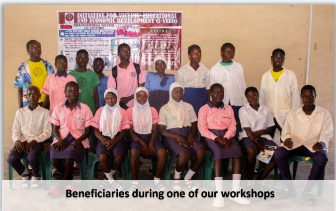
Beneficiaries during one of our workshops