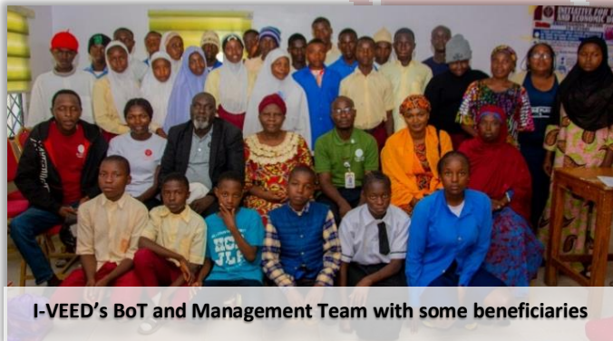
I-VEED's BoT and Management Team with some beneficiaries