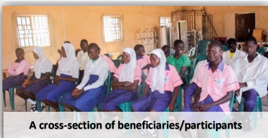
A cross-section of beneficiaries/participants