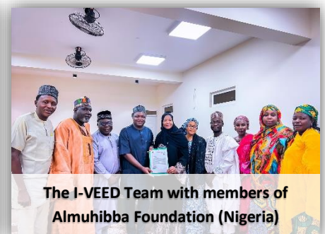
The I-VEED Team with members of Almuhibba Foundation (Nigeria)