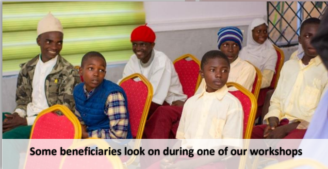
Some beneficiaries look on during one of our workshops