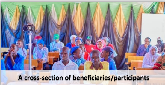
A cross-section of beneficiaries/participants